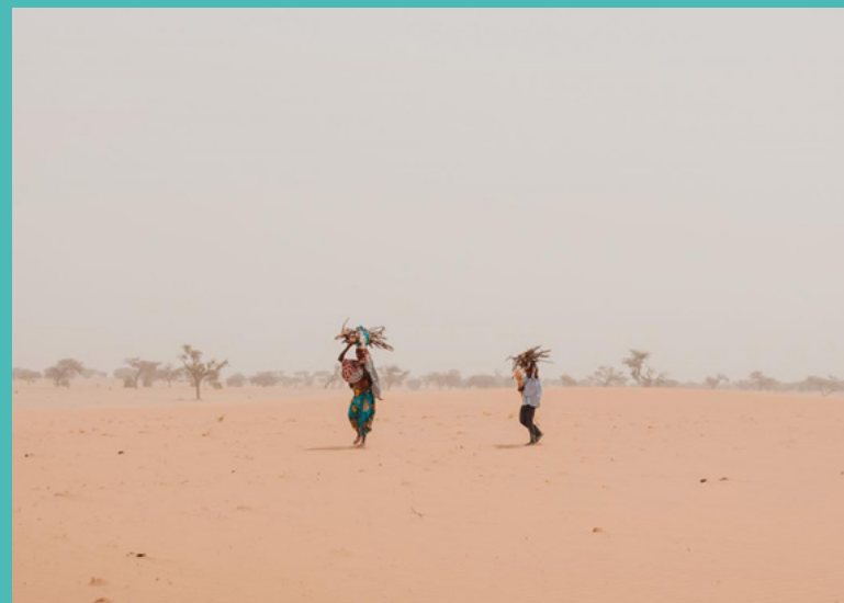
La désertification en Afrique, un enjeu majeur pour les systèmes de santé.

La France s'engage à développer des stratégies et programmes de prévention et de promotion de la santé, en orientant ses actions sur les déterminants de santé. La France agira également pour le développement de parcours de soins qui garantissent une prise en charge adéquate à tous les âges de la vie. Elle maintient un engagement fort pour lutter contre les maladies infectieuses et la résistance aux antimicrobiens, dans une approche Une seule santé.