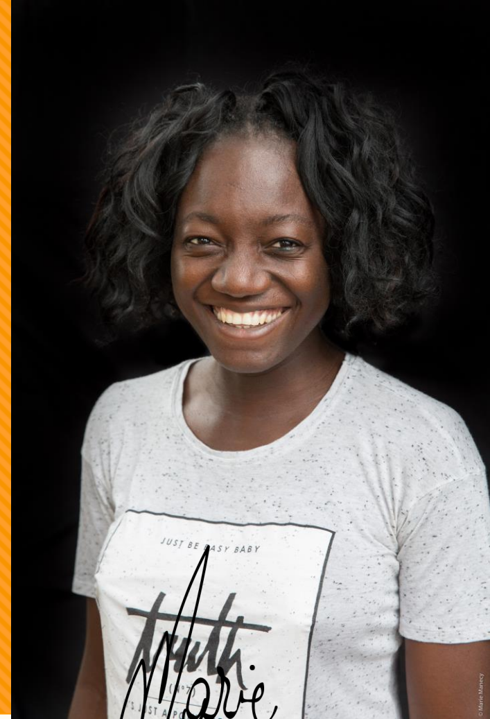
Marie MANECY PHOTOGRAPHE