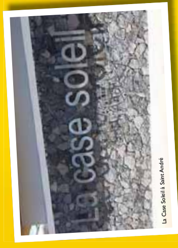
La Case Soleil à Saint-André

Les internats de prévention sont un dispositif innovant s'adressant à des jeunes âgés de 11 à 16 ans, en situation de problèmes sociaux ou familiales, en rupture scolaire, ou en voie de déscolarisation.